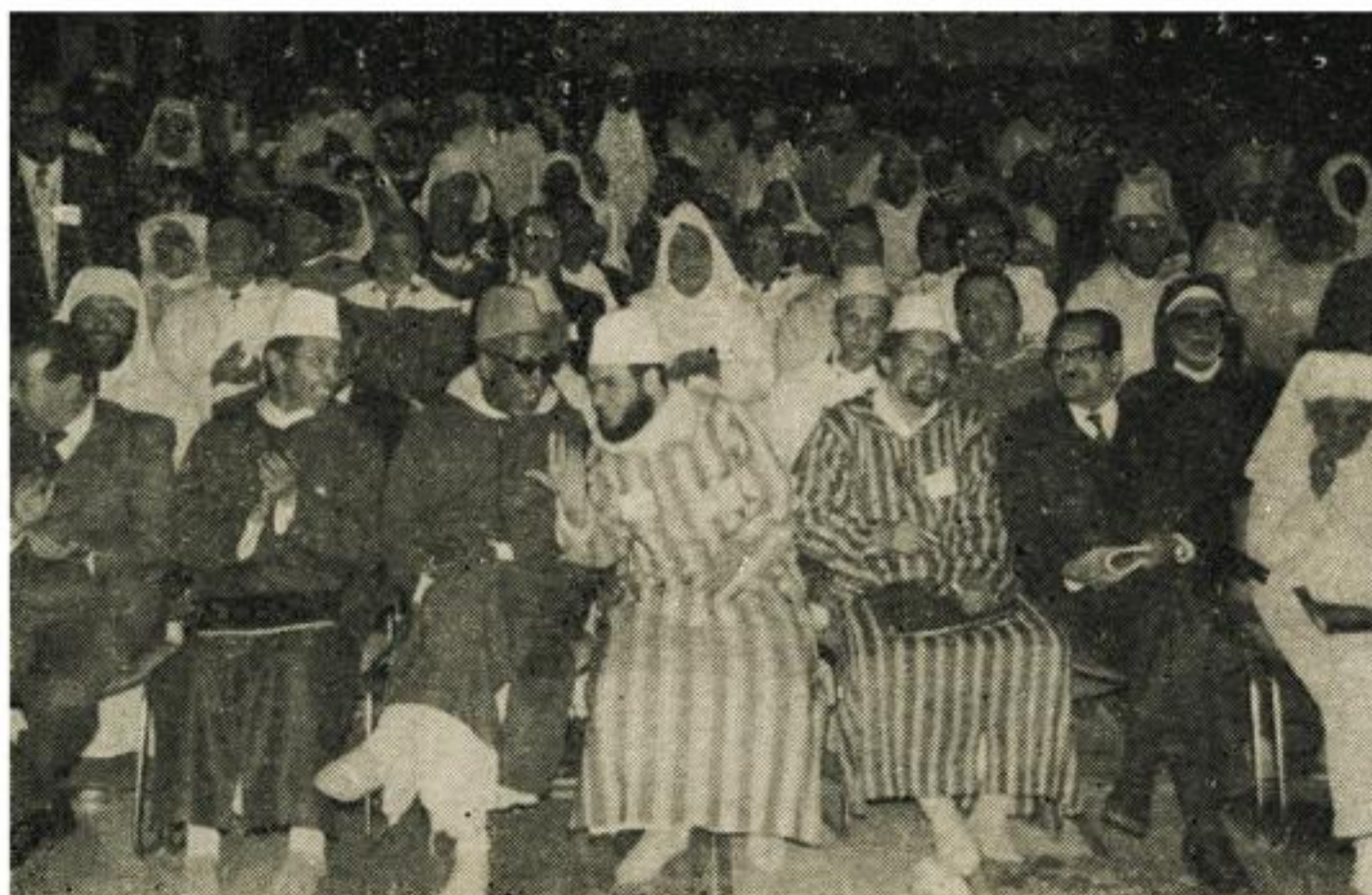
جانب من الحاضرين في المؤتمر

يسرني باسم جمعية الدعوة الاسلامية بشفشاون ان احبب المؤتمر العاشر لرابطة علماء المغرب الذي ينعقد بالعاصمة الاسماعيلية بمدينة مكناس :