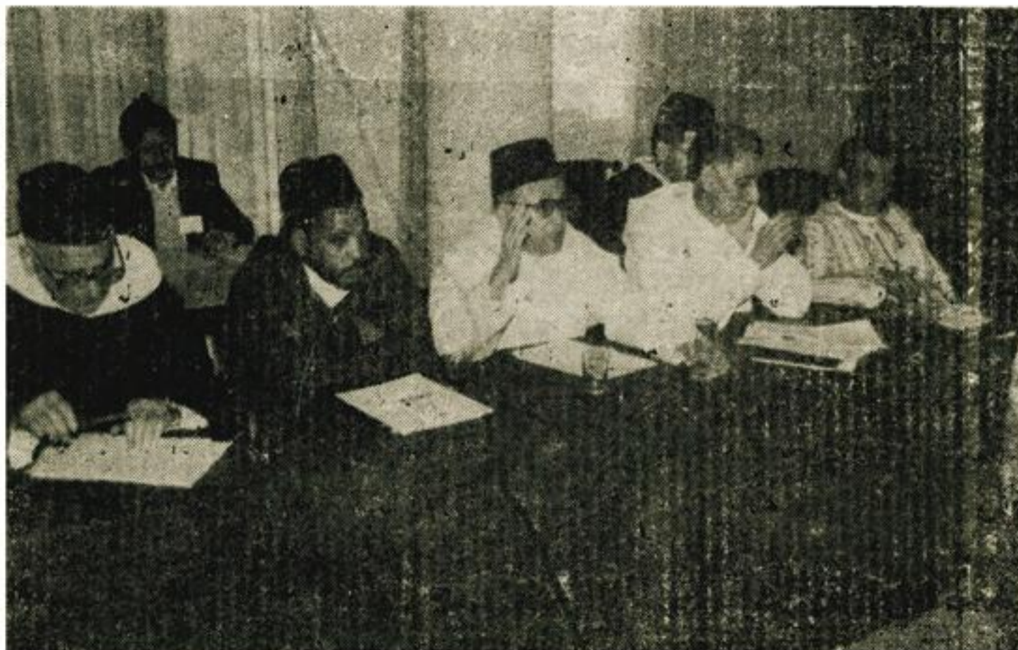
اجتماع اللجنة اثناء مناقشة التوصيات

( 8 ) هوة ملوك ورؤساء الدول الى لاسهام في مجال نشر الثقافة الاسلامية في مختلف الاقطار ، لئلا ات ولا مصار على غراز ما يقوم به المضرب مثلاً في قانده الملقم ، امير المؤمنين الحسن الثاني نصير الله ، من استقبال للبعوث الوفود على البعثات من مختلف اقطار العالم الاسلامي واغاد نحة من العلماء بقصد الدعوة الى الله تعالى ، ونشر تعاليم الاسلام السمحة تحت شارة ادع الى سبيل ربك بالحكمة والدعوة الحسنة سدد الله الخطى ، واعان العالمين على نصرة هذا الدين العظيم